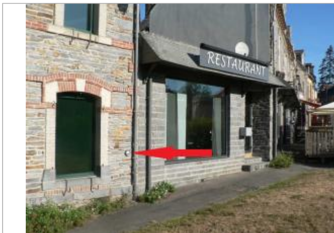
Bâtiment au 8 place de la ferronnerie à La Gacilly

Coordonnées WGS84 : X: -2.12944070 / Y: 47.76175400