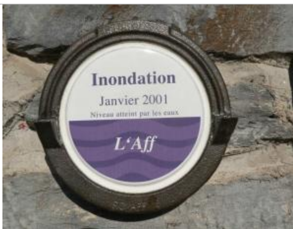
Repère normalisé de l'inondation du 5 janvier 2001