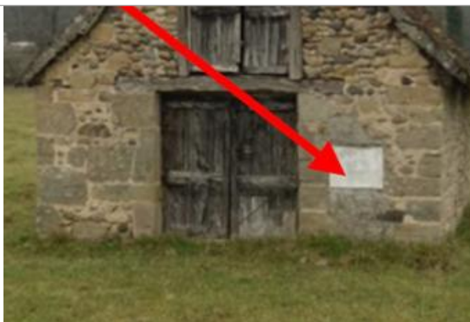
Photo du repère