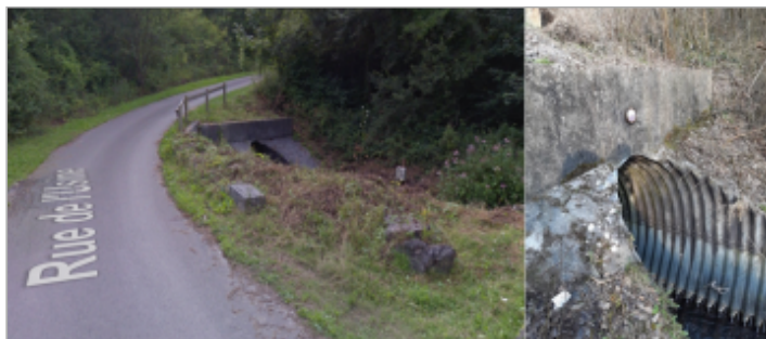
Ouvrage busé entre la rue du pont et la rue de l'usine ( ruisseau le crembreux)