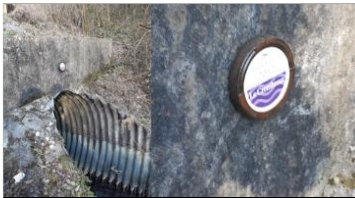
Support : Paroi de l'ouvrage busé