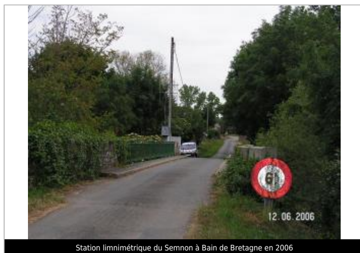
Station limnimétrique du Semnon à Bain de Bretagne en 2006

GÉOLOCALISATION Coordonnées WGS84 : X: -1.62984650 / Y: 47.86012480 Coordonnées RGF93 (Lambert 93) : X: 353994.97 / Y: 6761227.78 Coordonnées RGF93 (ETRS89) : X: -1.6298465 / Y: 47.8601248 Code Hydro: J76-0300 Rive de référence: Gauche