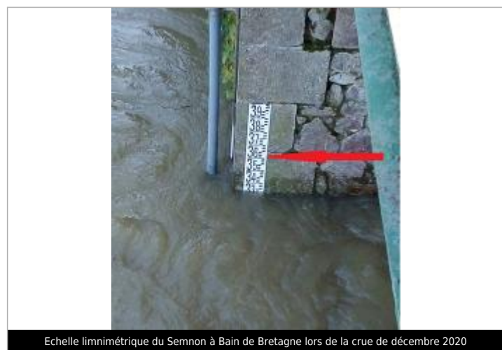
Echelle limnimétrique du Semnon à Bain de Bretagne lors de la crue de décembre 2020

GÉNÉRAL Code : SPC 35012_01_2000 Date de mise à jour : 13/04/2022 Auteur : SPC VCB