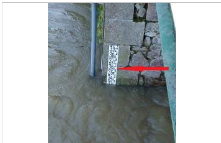
Echelle limnimétrique du Semnon à Bain de Bretagne lors de la crue de décembre 2000