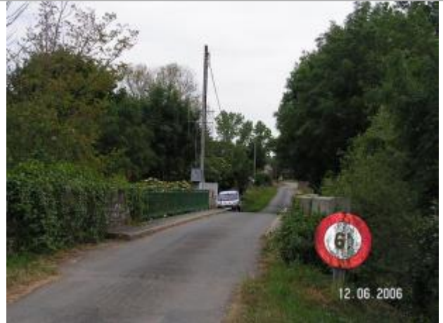
Station limnimétrique du Semnon à Bain de Bretagne en 2006