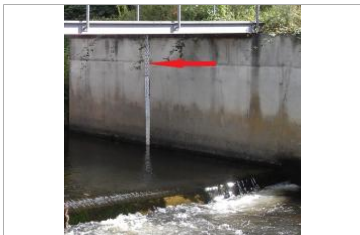
Echelle limnimétrique de l'Aven

Maximum de l'inondation : Oui Visibilité : Non État du repère : Bon Pérennité : Longue Repère calculé : Non PHEC : Oui