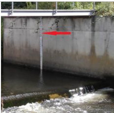
Echelle limnimétrique de l'Aven