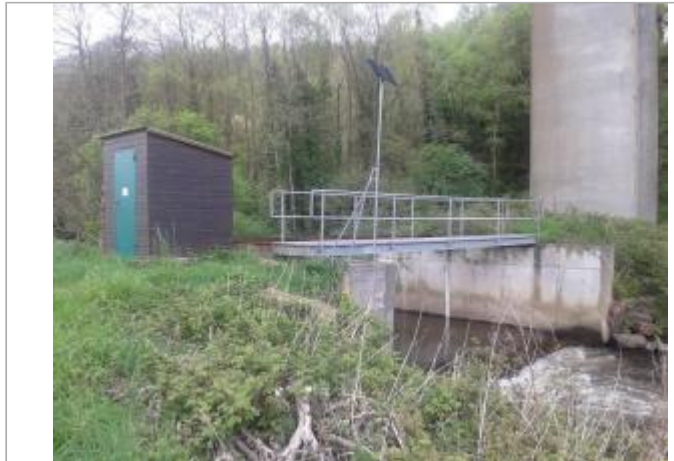
Station limnimétrique de l'Aven sous la RN 165