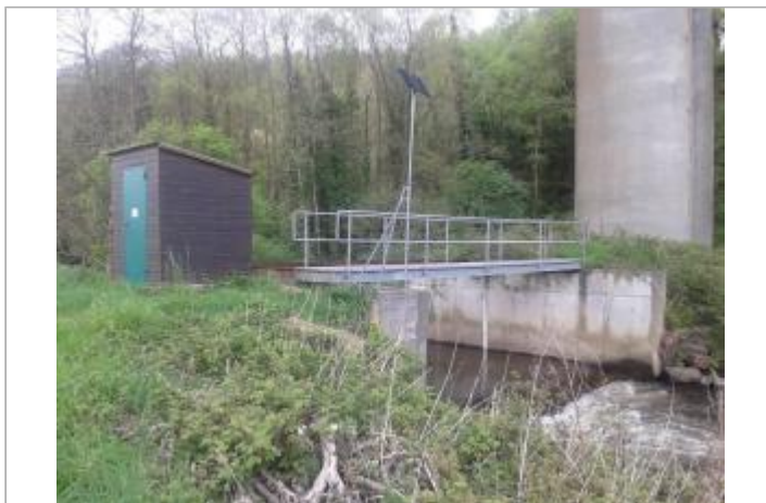
Station limnimétrique de l'Aven sous la RN 165