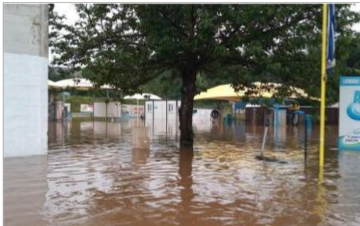
Station de lavage en face du 13 rue de La Touques