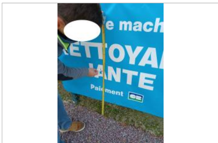
Laisse de crue à 61.5 cm/sol.

Altitude calculée de l'eau (en m) : 183.625