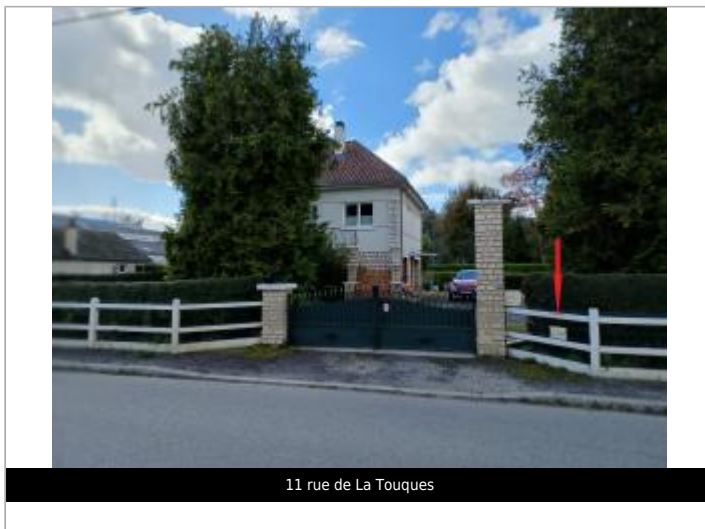
11 rue de La Touques