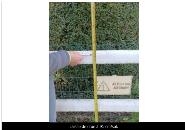
Laisse de crue à 91 cm/sol.

Altitude calculée de l'eau (en m) : 183.75