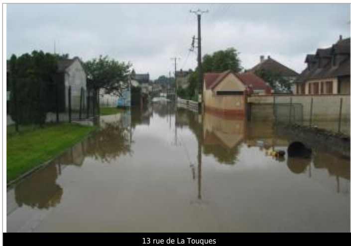
13 rue de La Touques