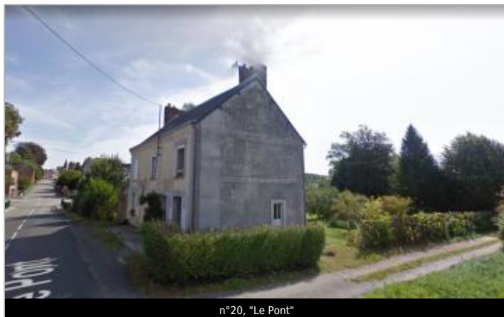
n°20, "Le Pont"