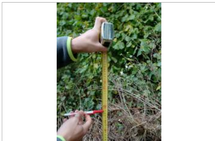
Laisse de crue à 108 cm/sol.

Altitude calculée de l'eau (en m) : 183.65 m