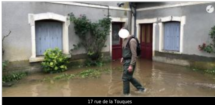
17 rue de la Touques