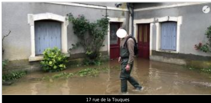
17 rue de la Touques