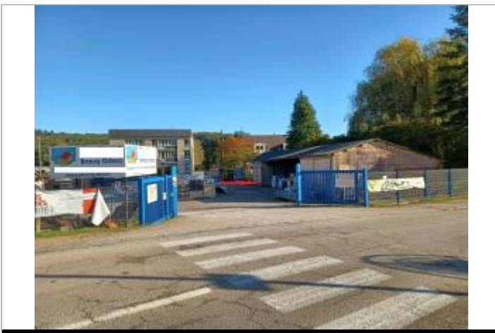
Mur de parpaings dans hangar au 50 rue des Canadiens

GÉOLOCALISATION Coordonnées WGS84 : X: 0.40104573 / Y: 49.02204700 Coordonnées RGF93 (Lambert 93) : X: 509944.87 / Y: 6883366.57 Coordonnées RGF93 (ETRS89) : X: 0.4010457 / Y: 49.022047 Code Hydro: I02-0400 Rive de référence: Gauche