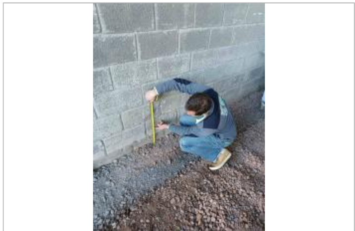
Laisse de crue sur le mur de parpaings

MARQUE Maximum de l'inondation : Oui Visibilité : Non État du repère : Disparu Pérennité : Aucune