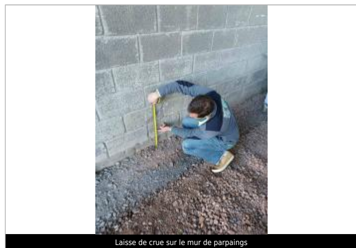
Laisse de crue sur le mur de parpaings