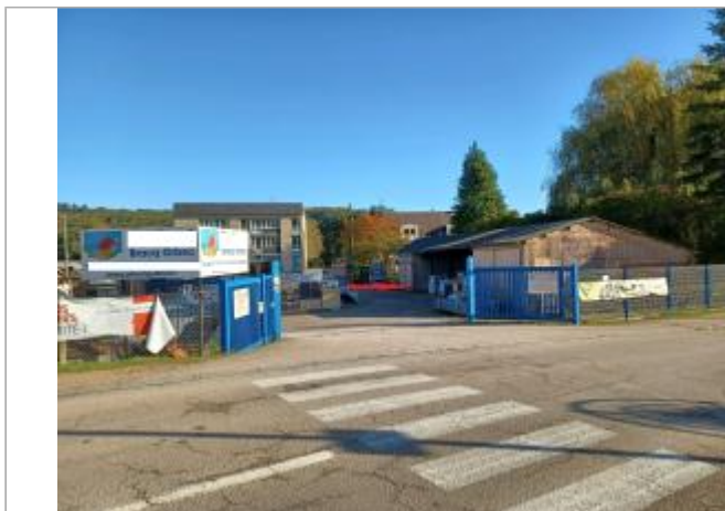
Mur de parpaings dans hangar au 50 rue des Canadiens