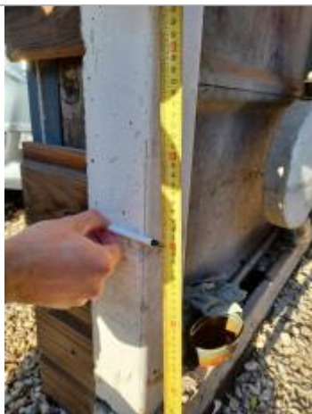
Laisse de crue à 40 cm/sol.

Organisme(s) : SPC Seine aval - Côtiers normands