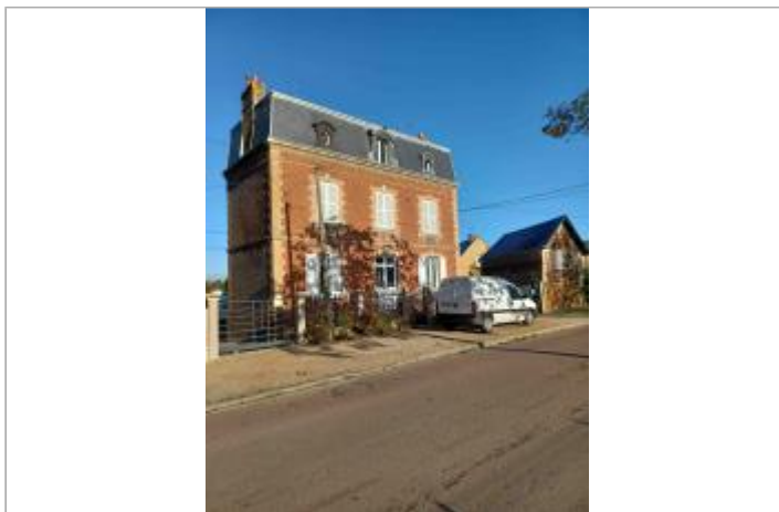
4 avenue de la Gare