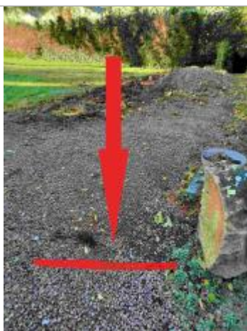
Laisse de crue sur le sol en graviers du jardin

Organisme(s) : SPC Seine aval - Côtiers normands