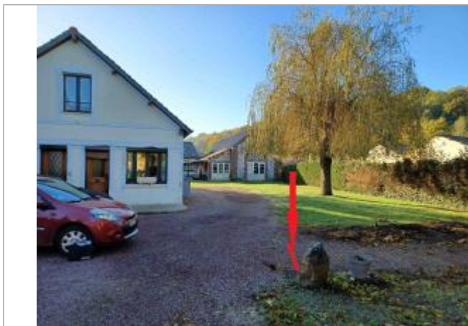
Sol en gravier du 31 rue des Canadiens