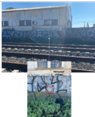
Niveau d'eau bien marqué sur le mur entre la voie ferrée et les entreprises