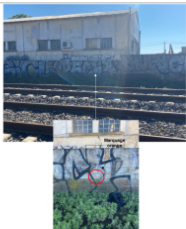
Niveau d'eau bien marqué sur le mur entre la voie ferrée et les entreprises

Altitude calculée de l'eau (en m) : 30.66 m