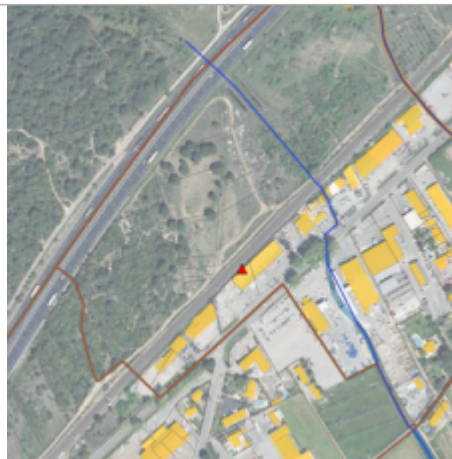
DBA Performance - 16 bis N113