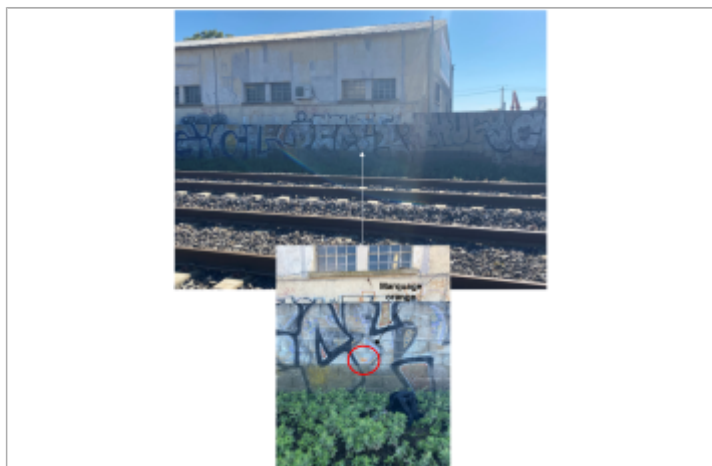
Niveau d'eau bien marqué sur le mur entre la voie ferrée et les entreprises