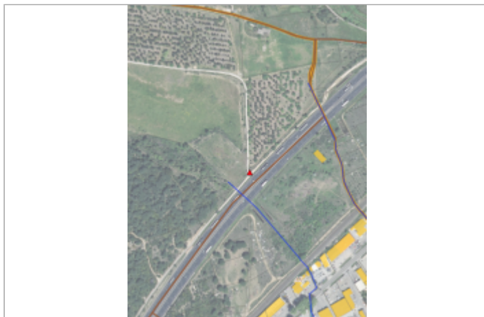
1080 chemin du Pont de la Roque