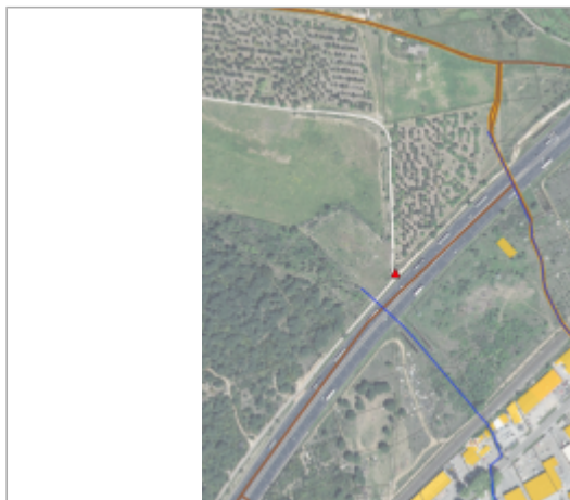
1080 chemin du Pont de la Roque