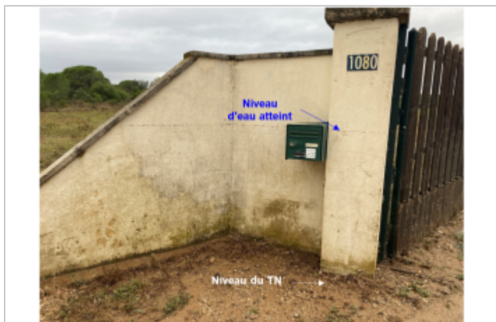
Niveau d'eau bien marqué sur le mur d'enceinte de la propriété privée

Altitude calculée de l'eau (en m) : 33.63