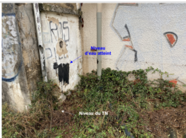
Niveau d'eau bien marqué sur le mur du bâtiment