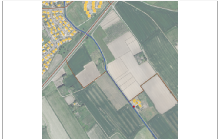
STEP - Chemin du Trisolet