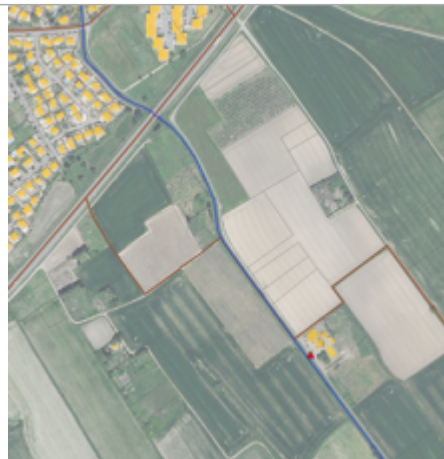
STEP - Chemin du Trisolet