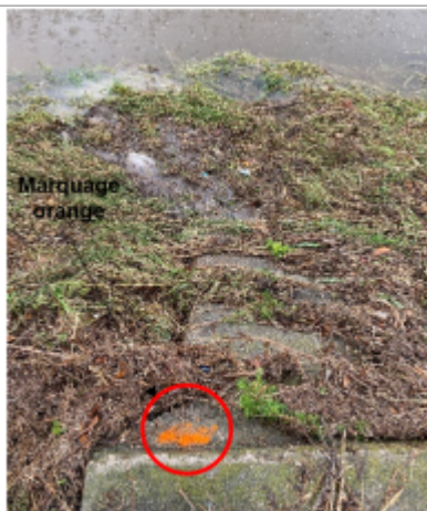
Trace bien visible au niveau de la berge