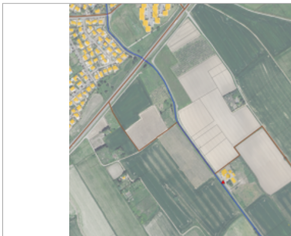
STEP - Chemin du Trisolet