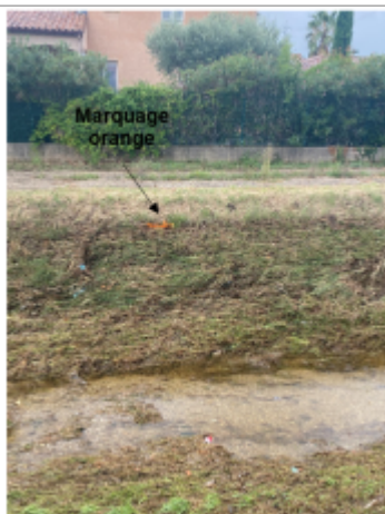
Trace bien visible au niveau de la berge

Altitude calculée de l'eau (en m) : 23.41