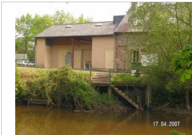
Ancienne station limnimétrique de la Seiche à la clinique de Carcé