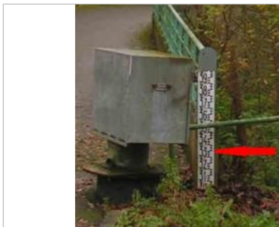
Echelle limnimétrique de l'ancienne station de la Seiche à Carcé