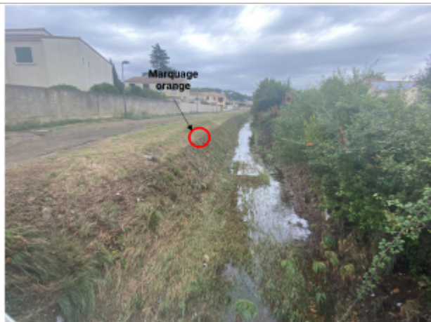
Trace bien visible au niveau de la berge