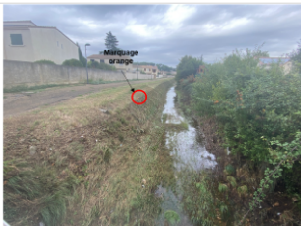
Trace bien visible au niveau de la berge