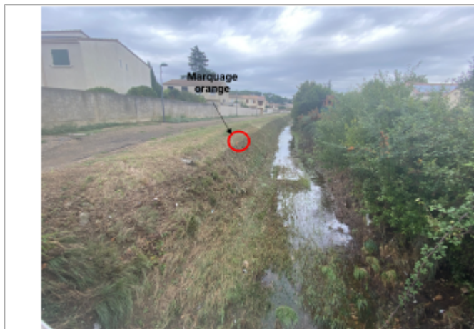
Trace bien visible au niveau de la berge