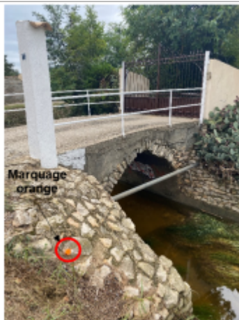
Projection d'une trace bien visible au niveau de la berge sur l'enrochement

Altitude calculée de l'eau (en m) : 26.28