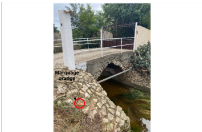
Projection d'une trace bien visible au niveau de la berge sur l'enrochement

Pérennité : Moyenne État du repère : Non renseigné