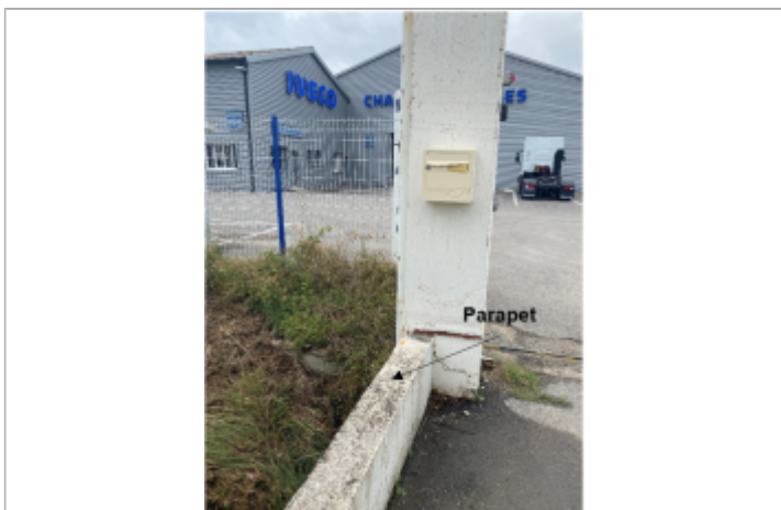
Niveau atteint est 97 cm en dessous du niveau haut du parapet