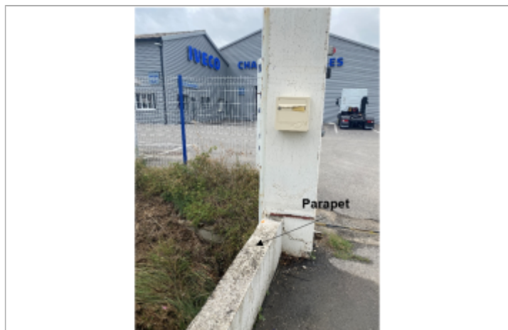
Niveau atteint est 97 cm en dessous du niveau haut du parapet