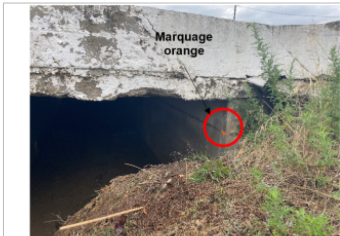
Niveau d'eau bien marqué sur le génie civil de l'ouvrage