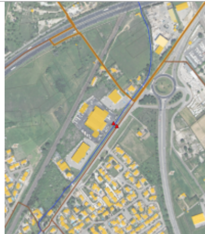
Passerelle d'accès à la société IVECO - Route de Nîmes