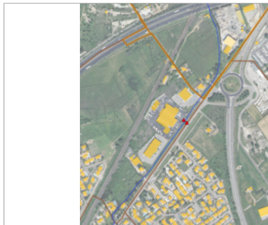
Passerelle d'accès à la société IVECO - Route de Nîmes