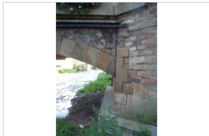
Marque inondation sur le pont charlemagne

GÉNÉRAL Code : WEB_R_202203253208 Date de mise à jour : 29/03/2022 Auteur : Florence B. OTEIS