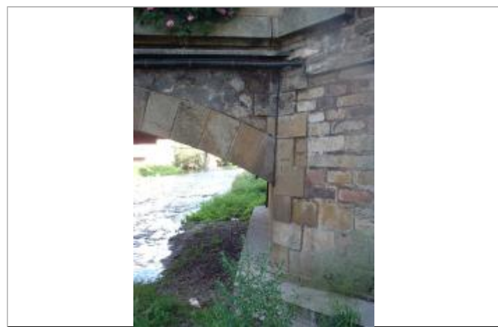
Marque inondation sur le pont charlemagne

GÉNÉRAL Code : WEB_R_202203253208 Date de mise à jour : 29/03/2022