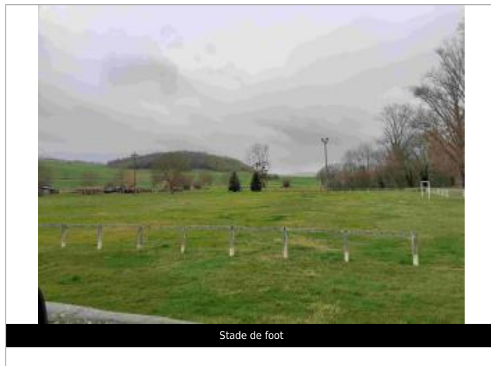
Stade de foot