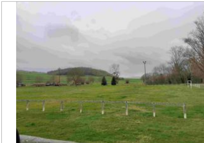
Stade de foot