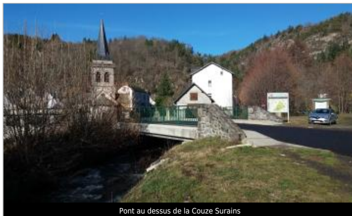
Pont au dessus de la Couze Surains