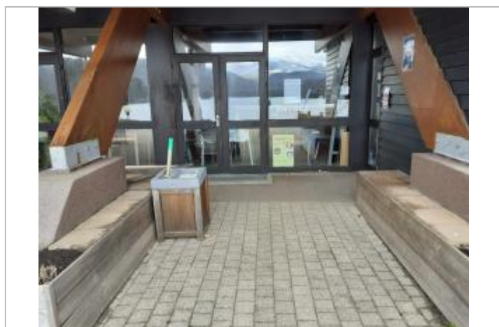
Porte du restaurant plage du lac chambon

Méthode : Non renseigné Organisme : OTEIS Référence nivelée : Marque d'inondation Système altimétrique : NGF IGN 1969 (système normal) Altitude de la référence (en m) : 877.450 m Altitude calculée de l'eau (en m) : 877.45 m