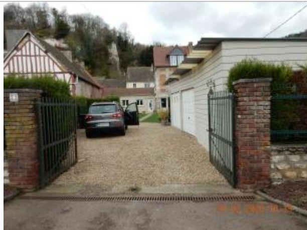
Cours du pavillon au 23 Quai des Roches