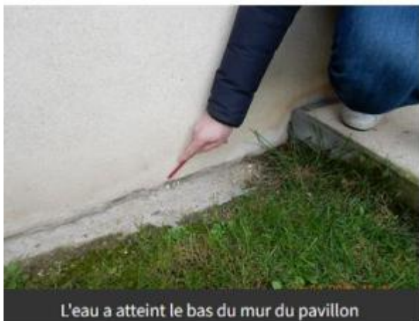
L'eau a atteint le bas du mur du pavillon