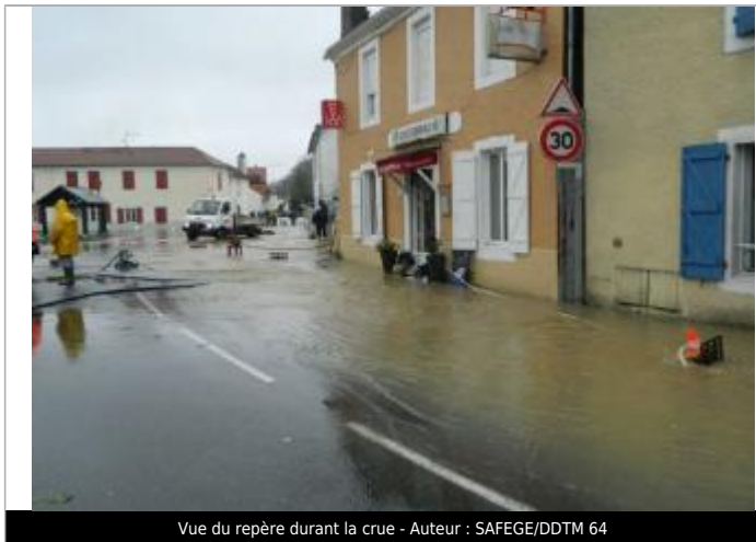
Vue du repère durant la crue

SOURCE DE REPÉRAGE : ENQUÊTE DE TERRAIN ÉLÉMENTS INGÉNIERIES - SAFEGE POUR LA DDTM 64 - 25/01/2014