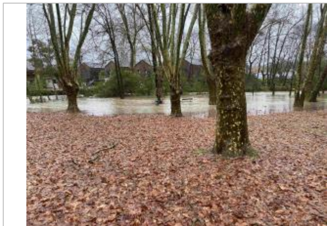
Vue du repère durant l'inondation (de l'amont vers l'aval) - Auteur : Commune de Lons

SOURCE DE REPÉRAGE : SMBGP 2022 - 01/02/2022