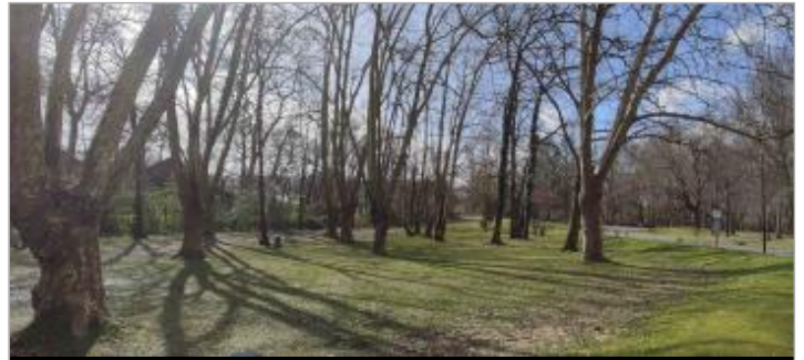
Vue du site (de l'amont vers l'aval)