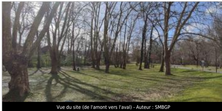
Vue du site (de l'amont vers l'aval) - Auteur : SMBGP