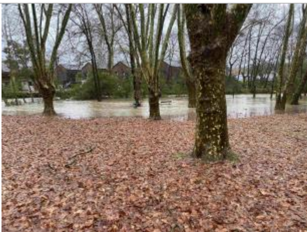
Vue du repère durant l'inondation (de l'amont vers l'aval)

Altitude calculée de l'eau (en m) : 191.334