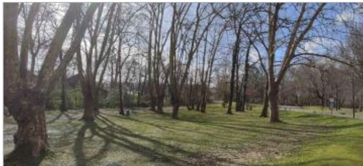
Vue du site (de l'amont vers l'aval)