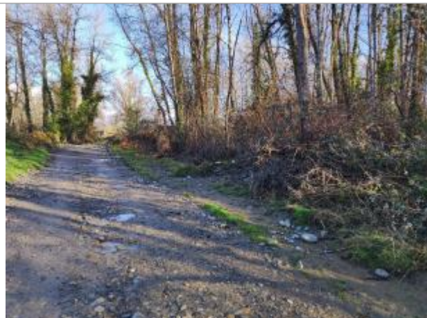
Vue du site (de l'amont vers l'aval)

Coordonnées WGS84 : X: -0.31612540 / Y: 43.26096200