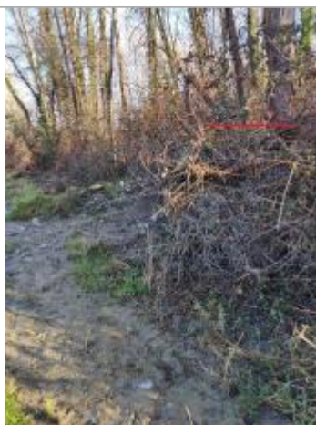
Vue du repère (le trait rouge représente le niveau atteint par les eaux)