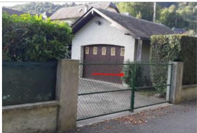
Vue du repère (la flèche rouge représente le niveau atteint par les eaux sur la porte du garage)

Altitude calculée de l'eau (en m) : 290.26