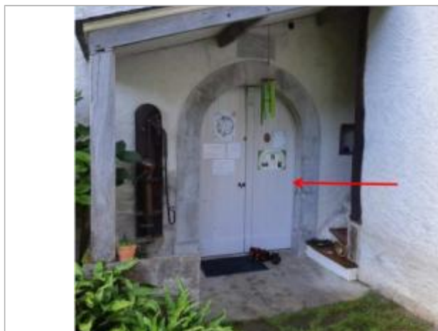
Vue du repère (la flèche rouge représente le niveau atteint par les eaux)