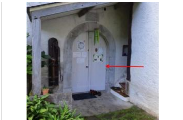
Vue du repère (la flèche rouge représente le niveau atteint par les eaux) - Auteur : HEA

Altitude calculée de l'eau (en m) : 351.1