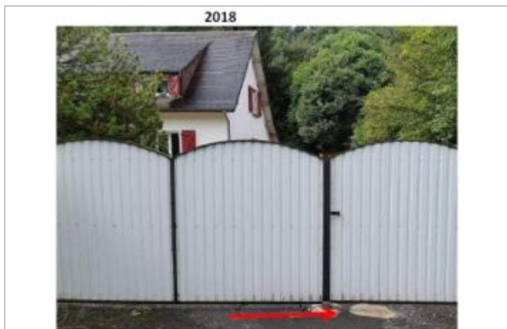
Vue du repère (la flèche rouge représente le niveau atteint par les eaux) - Auteur : HEA