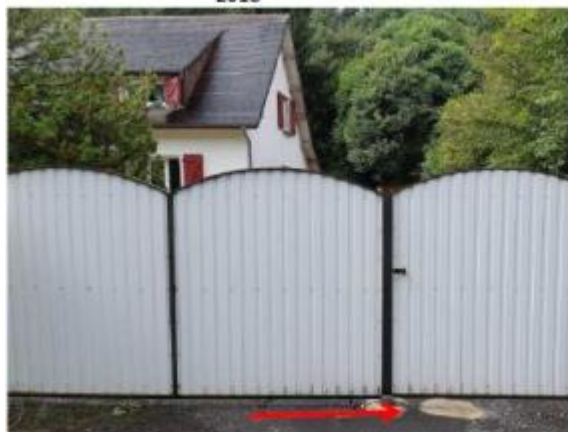
Vue du repère (la flèche rouge représente le niveau atteint par les eaux)