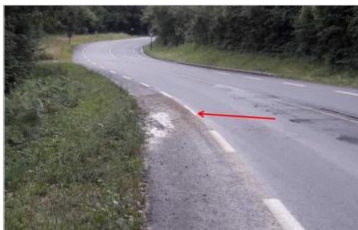
Vue du repère (la flèche rouge représente le niveau atteint par les eaux)