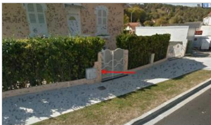
Vue du repère (la flèche rouge représente le niveau atteint par les eaux) - Auteur : HEA