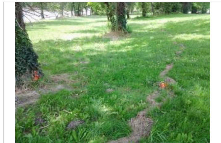
Vue du repère (l'eau est arrivée au pied du piquet orange)

GÉNÉRAL Code : WEB_R_202203233535 Date de mise à jour : 23/03/2022 Auteur : SMBGP