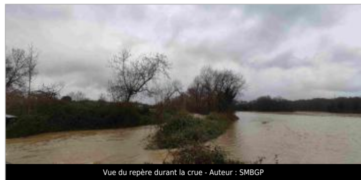
Vue du repère durant la crue