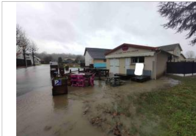
Vue du repère durant la crue